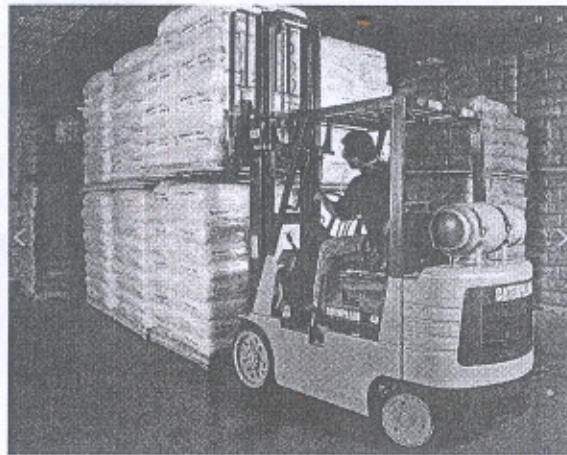
Hàng đóng bao, hoặc thùng carton phải đặt trên pallet